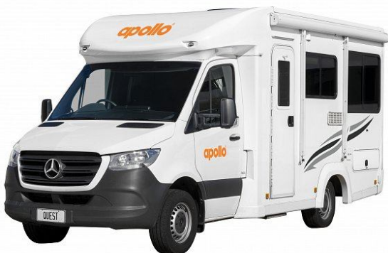
Apollo Euro Quest