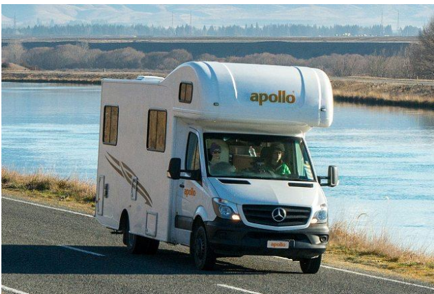
Apollo Euro Camper