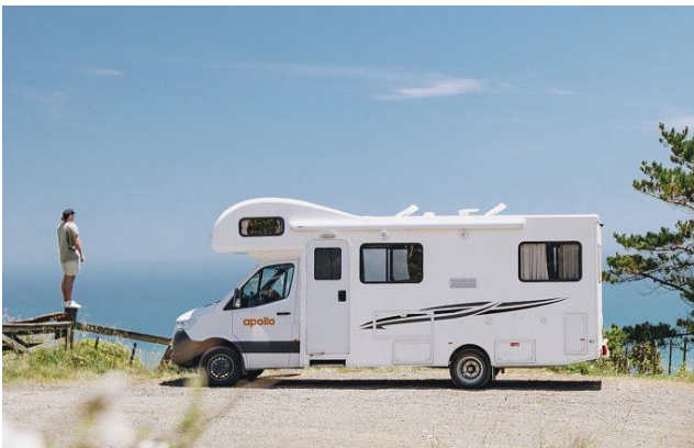
Apollo Euro Deluxe